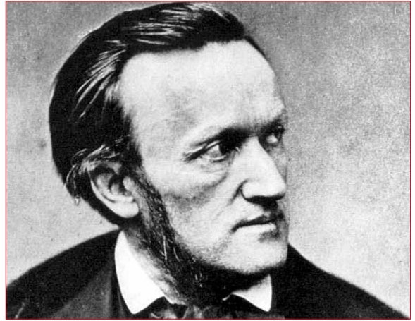
Richard Wagner, Paris 1861