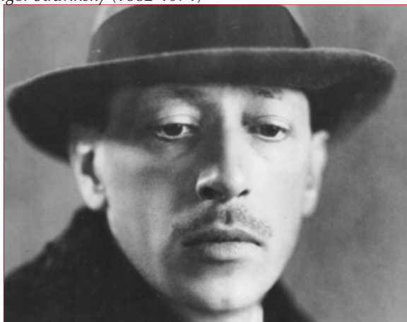
Igor Stravinsky (1882-1971)